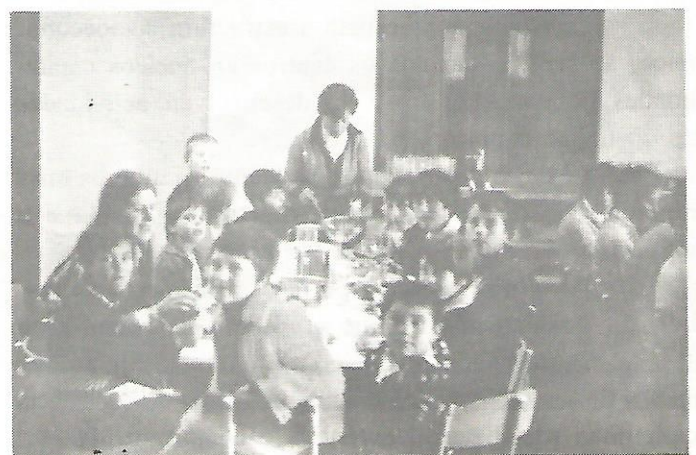
“Escuela-Hogar”. Veleiquí uns nenos que non xantan coa familia

No aspecto humano, concentracións tan disconformes coma as que require este sistema, fai que a socialización perda as súas virtudes quedando nunha desperoalización e tipificación dos nenos, xa que a toma de contacto social vai ser tan fría e superficial que non pode ser constructiva nas primeiras etapas da educación, cando o neno ten que forxar vivencias moi achegadas.