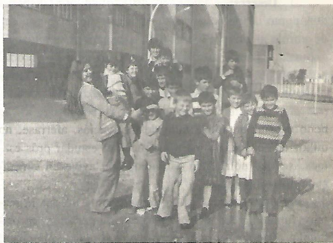
Todos istes nenos de Ancares (Cervantes) pasan o curso internos na "Escuela-Hogar" de Sarria, a 80 kilómetro das súas casas

Desde que o neno se fai bon coñecedor, investigador i elaborador do seu mundo pode dempóis moverse con seguridade noutro calquera, pois que xa ten desenroladas unhas facultades efectivas pra elo, acadou seguridade en sí mesmo e o asentamento da súa personalidade. A partires de aquí poderá actuar con tódolas súas