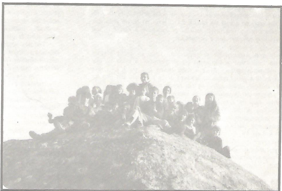
O MEC está moi lonxe destes nenos

PEDIMOS QUE SE ESCOMENCE POR DESARTELLAR UNS MODELOS DE ESCOLARIZACION TAN IRRACIONAIS, COMA OS QUE SE ESTAN LEVANDO A CABO, E SE PLANIFIQUE DENTRO DUN SISTEMA CONFORME COA DIVERSIDADE DA PROBLEMATICA GALEGA.