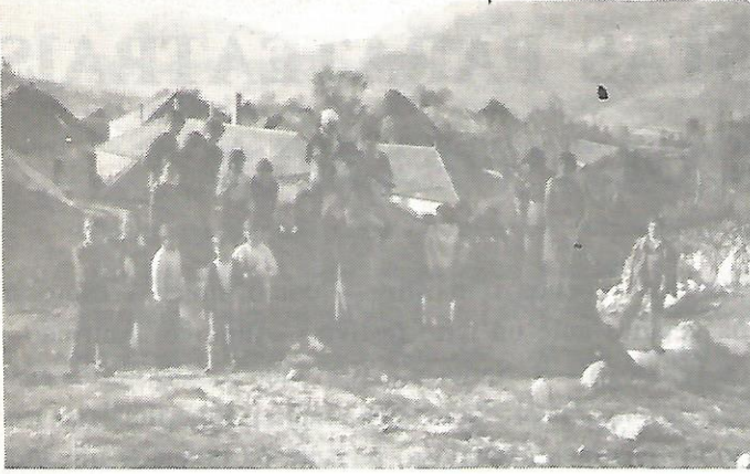
A relación entre escolas mantén a comunicación entre pobos. (Nenos de tres escolas de Cervantes)

táneamente unha infancia ceibe doutras imposicións alleas ao seu medio. Unha rachadela que raxe esta “urdime consustancial” é unha verdadeira fanadura que dá na consecuencia máis drástica: unha educación deshumanizada i esnaquizadora da personalidade dos pobos.