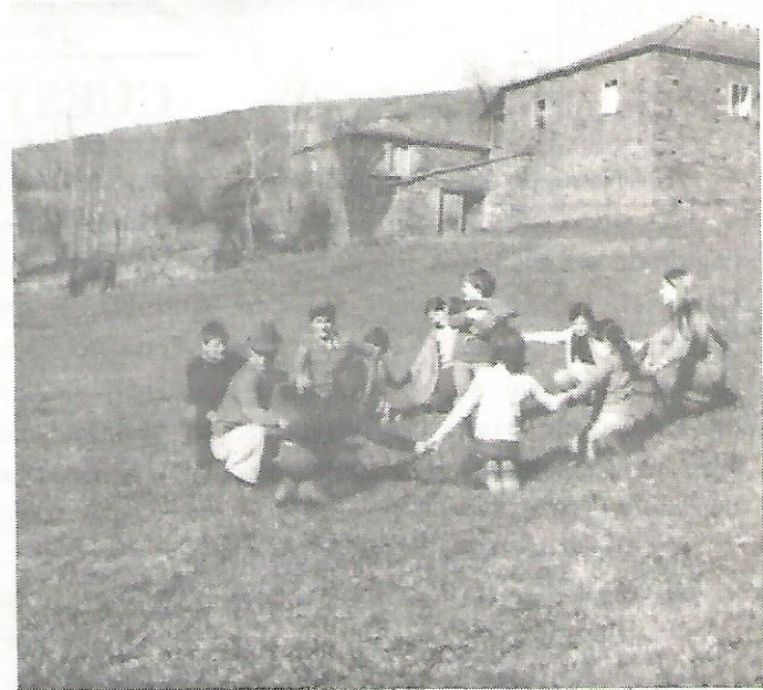
A escola conserva a vida dos pobos