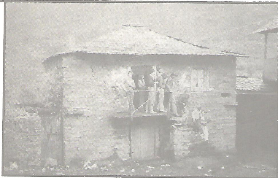
A escola rural estropear a paisaxe

cárego ao longo da súa concienciación cara ao futuro. Deste xeito respétase e desenrólase a súa propia cultura e prepárase ao individuo como axente promotor do seu medio.